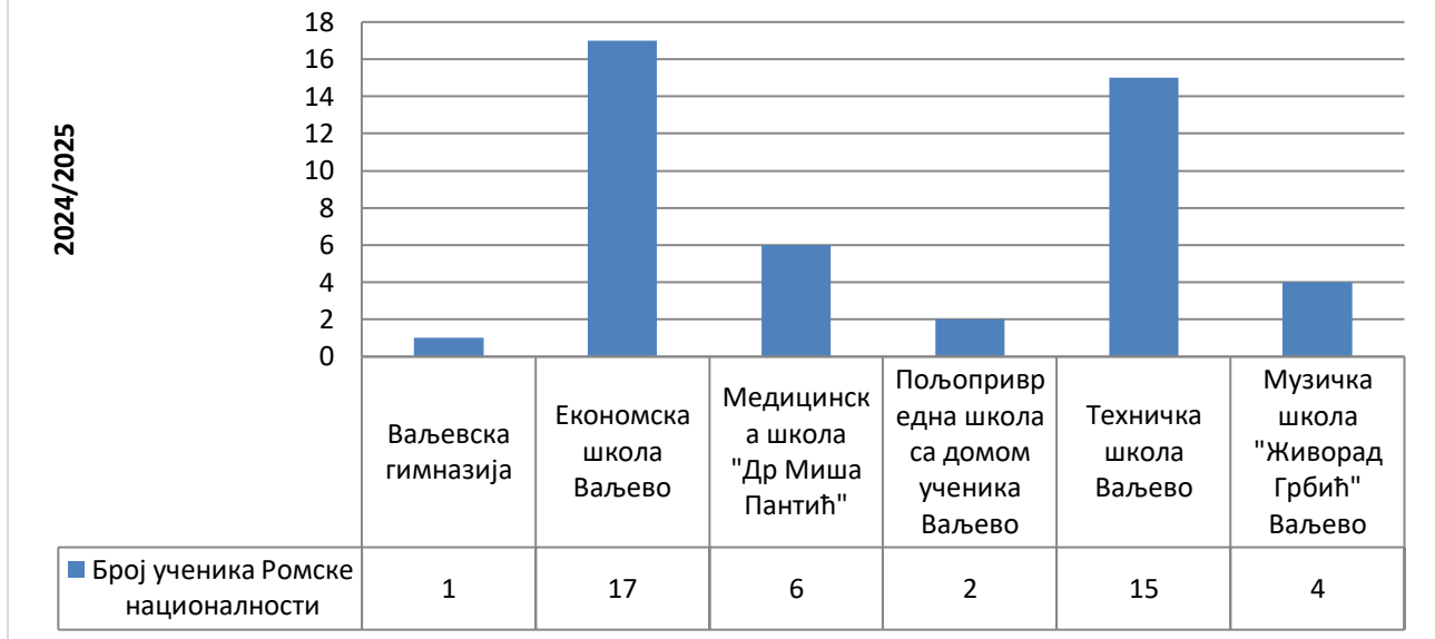
Графикон број 2 – Дистрибуција ученика уписаних у средње школе 2024/2025. године у граду Ваљевоу