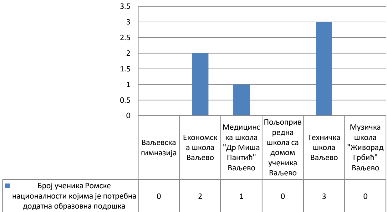
Графикон број 4 – Број ученика Ромске националности којима је потребна додатна образовна подршка